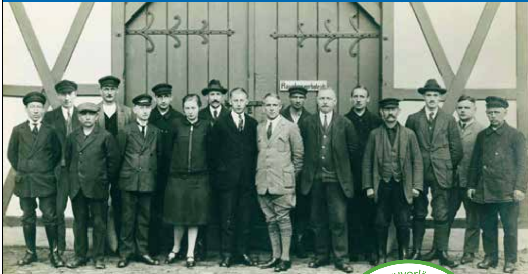
Gut aufgestellt: Die e-werk-Mannschaft von 1927