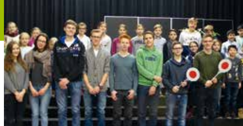
Vorn: die Schülerlotsen, hinten: die betreuten Grundschüler

jc – Morgens, kurz vor 8.00 Uhr, ist viel los vor der Grundschule. Hunderte kleiner Kinder strömen laut schnatternd und tobend über den Schulhof. Aber nicht nur hier, auch auf den Zugangsstraßen ist großes Gewusel zu beobachten. Am Kreisel Petersilienberg müssen sich die Autofahrer gedulden, aus und in Richtung Reinbek kommt es zu erheblichen Staus.