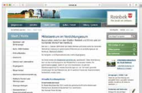
Oben die Website und links das Logo des Mittelzentrums Reinbek/Glinde/Wentorf bei Hamburg

jc – Auch Wentorf profitiert von den Landeszuschüssen. Es ist Teil eines „Mittelzentrums im Verdichtungsraum“, das mit Reinbek und Glinde 2009 gegründet wurde. Ein politisches Neuland für die beiden Städte und die Gemeinde Wentorf. Ein Gremium musste gebildet, viele Gespräche geführt und Beratungen in den hauseigenen Gremien abgehalten werden. Im Mai 2010 wurde der Kooperationsvertrag schon unterschrieben. Diese Vereinbarung kann als Arbeitsprogramm für das Mittelzentrum angesehen werden: Vermeidung gegenseitiger Konkurrenz, vergleichbare Daten erstellen, um gemeinsame Handlungsfelder festzulegen, abgestimmte Entwicklung von Wohn- und Gewerbeflächen, Infrastruktur, Einzelhandel, Wirtschaft, Schulentwicklung, Seniorenpolitik.